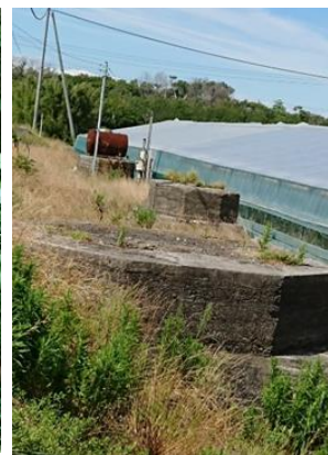
陸軍遠江射場跡 (浜野)

貴重な資料が生かされ、市 民に平和へのバトンが受け継が れていくことを望みます。