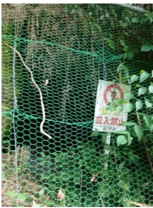
中島飛行機浜松製作所 掛川地下工場跡(遊家)