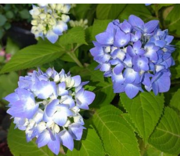
あじさいの色づく6月