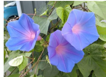
今年も咲いた アサガオ