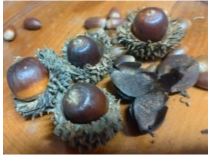
市役所の森の木の実たち

再生可能エネルギー条例の中で設定をしていく」と回答しています。改めて水源涵養林土砂災害多発地域の上を触る開発のリスクを感じました。