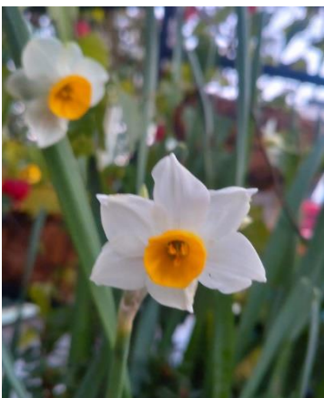
年が明け水仙が咲き始めました