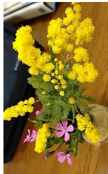
ミモザが咲きました

一方国の中心にいる方々は脱税に裏金つくり。確定申告して税金納める国民を裏切り続けています。